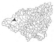
Relevé d'Orceмонт au Domaine de Val de France